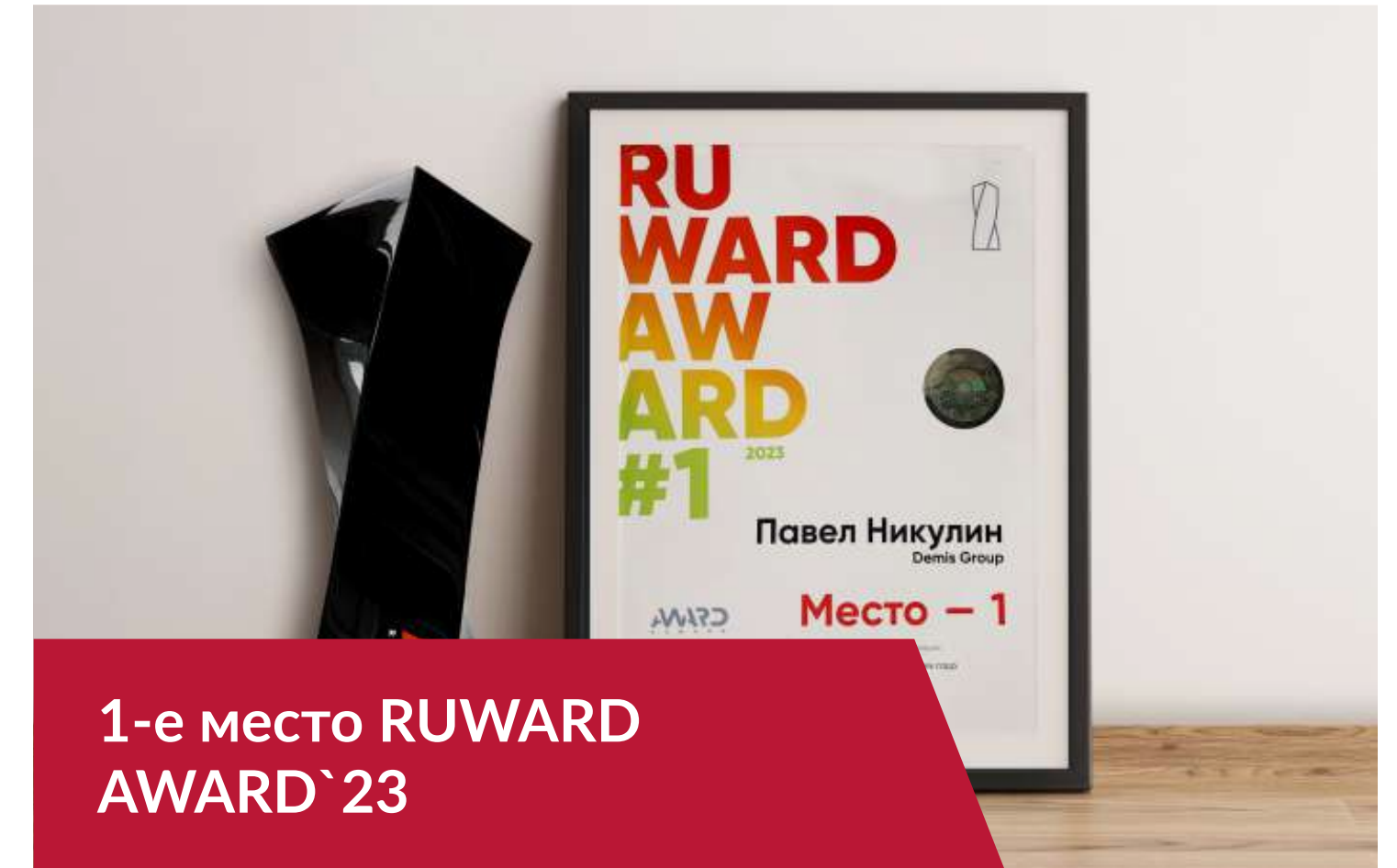
1-е место RUWARD AWARD`23