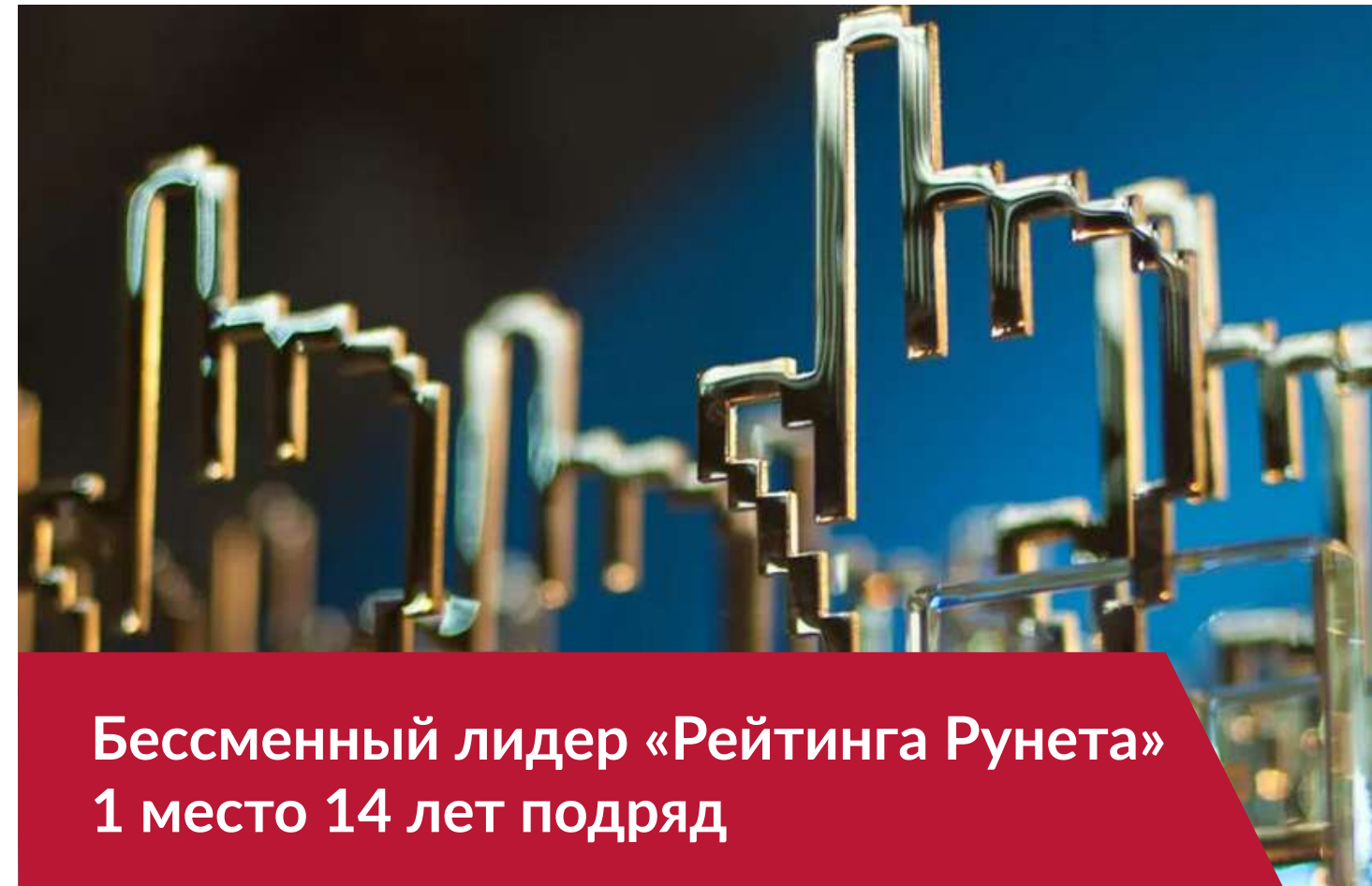
Бессменный лидер «Рейтинга Рунета» 1 место 14 лет подряд