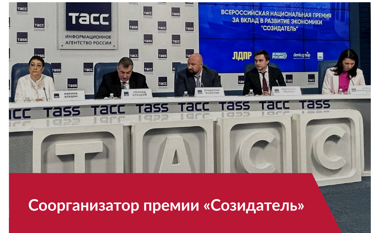
Соорганизатор премии «Созидатель»