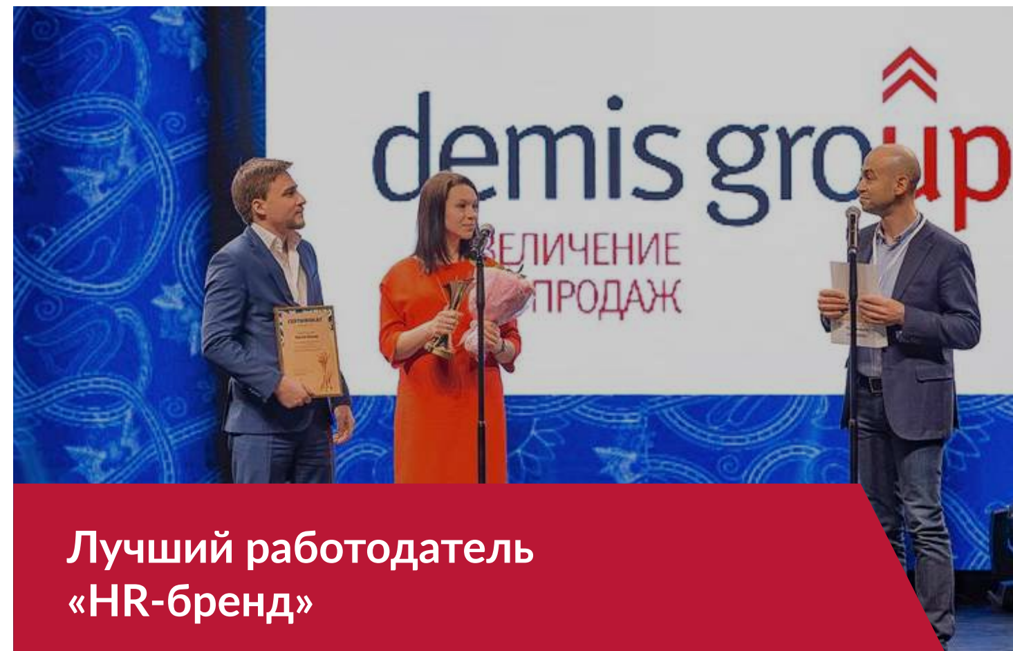
Лучший работодатель «HR-бренд»